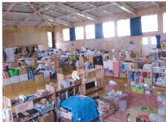
東日本大震災の避難所での組手什活用事例