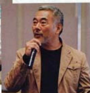
写真家 天野 尚さん