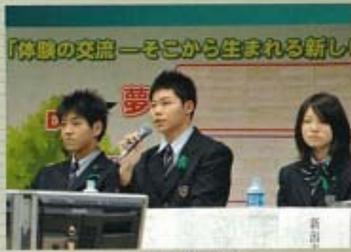
新潟青陵高校 生徒代表