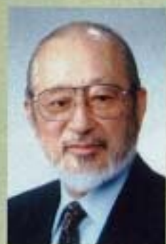
にいがた緑の百年物語 10周年記念フェスティバル実行委員会 委員長

緑百年物語を歩み出して十年目に又改めて百年に向かって一歩ずつ、一本ずつ木を植えて行くことではありませんか。緑多き日本各地を旅し、そして又緑多き国々を旅し、そこに住む人達の努力を改めて自分自身胸の中にとめたいと思います。「前人樹を植えれば後人涼し。」これは我々新潟に住む人間と各々その家族のために！